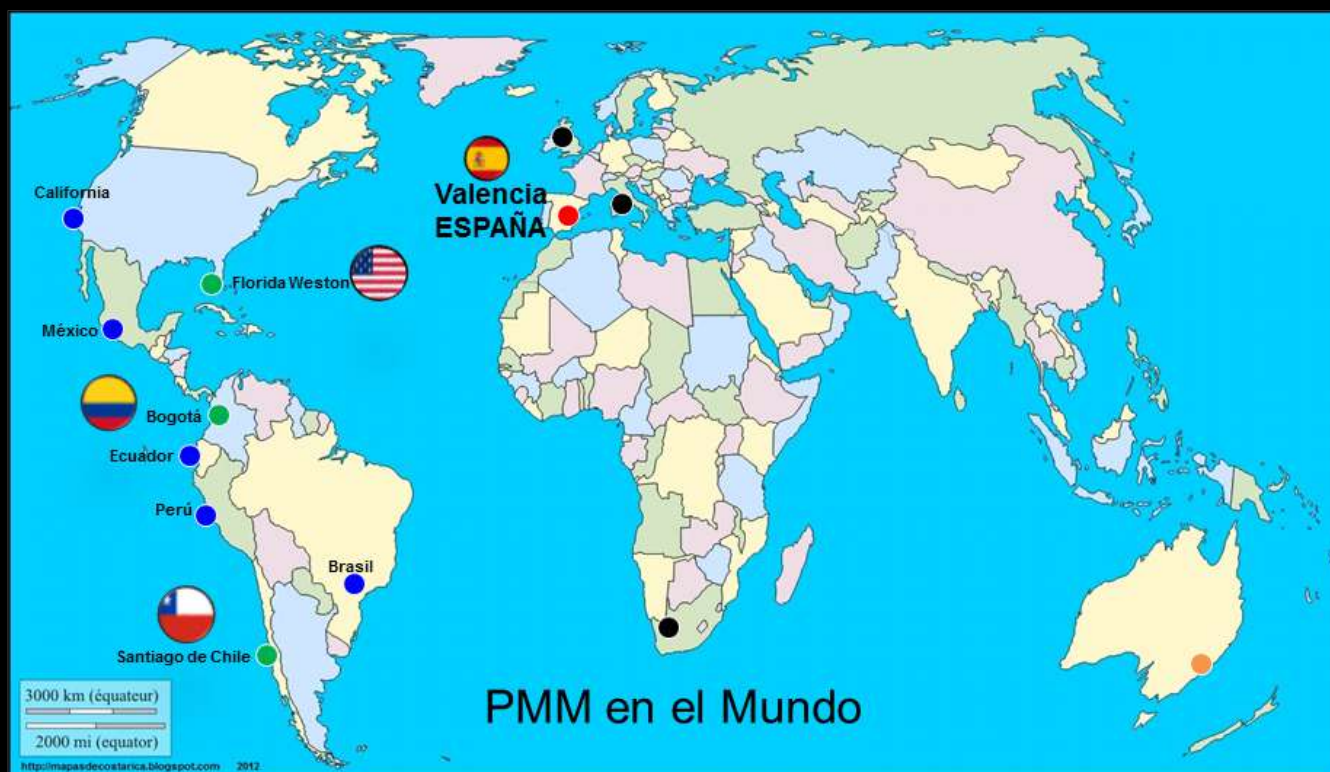
PMM en el Mundo