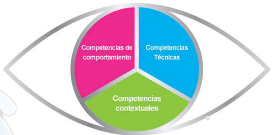
Ojo de la Competencia

UNE-ISO 21500 proporciona un alto nivel de descripción de los conceptos y procesos que se consideran para formar buenas prácticas en la gestión de proyectos. Los nuevos gerentes del proyecto, así como los gestores experimentados podrán utilizar la guía de gestión de proyectos en esta norma para mejorar el éxito del proyecto y lograr resultados de negocio.