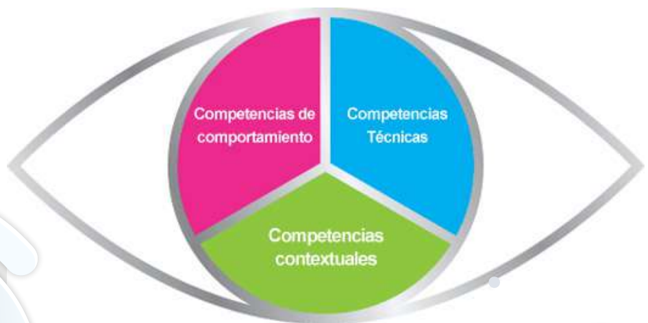
Ojo de la Competencia

UNE-ISO 21500 proporciona un alto nivel de descripción de los conceptos y procesos que se consideran para formar buenas prácticas en la gestión de proyectos. Los nuevos gerentes del proyecto, así como los gestores experimentados podrán utilizar la guía de gestión de proyectos en esta norma para mejorar el éxito del proyecto y lograr resultados de negocio.